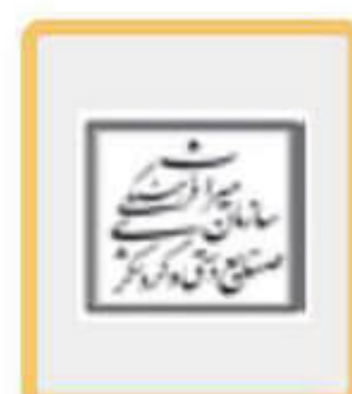
میراث فرهنگی یاسوج