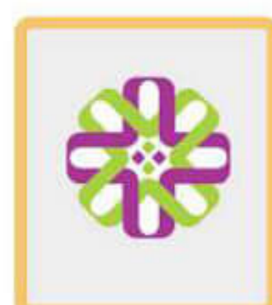
مهندسی سیستم یاس ارغوانی