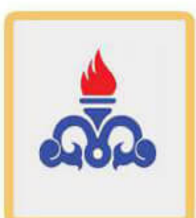
پخش فرآورده های نفتی اردبیل